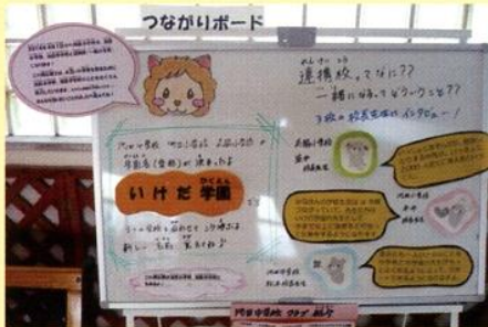
▲ 呉服小学校のつながりボード

池田中学校区では、それぞれの学校に、各学校だよりやMTP通信を貼る掲示板と各校の行事や様子、子ども、先生等を紹介し、子どもがつながっていけるような「つながりボード」を設置しています。池田中学校区は連携型の小中一貫校になりますので、このコーナーを通してそれぞれの学校を身近に感じて欲しいと思います。