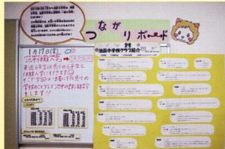
▲ 池田小学校のつながりボード