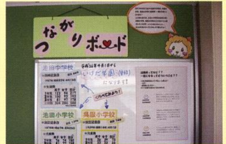
▲ 池田中学校のつながりボード