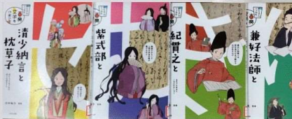
『ビジュアルでつかむ古典文学の作家たち』4巻 川村裕子 ほるぷ出版