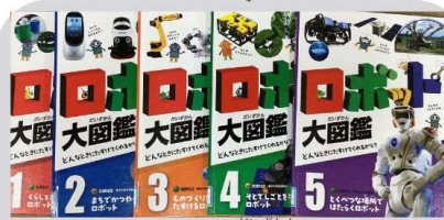
『ロボット大図鑑』 全5巻 佐藤知正 ポプラ社