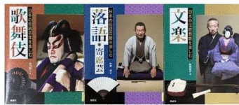
『日本の伝統芸能を楽しむ 歌舞伎 落語・寄席芸 文楽』 矢内賢二ほか 偕成社