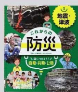
『これからの防災身につけよう 自助・共助・公助』 全4巻 近藤誠司 ポプラ社