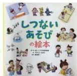
『しつないあそびの絵本』 WILLこども知育研究所 金の星社