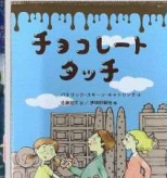
『チョコレートタッチ』 パトリック・スキーン・キャトリング 文研出版