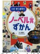
『これがきっかけ！ノーベル賞ずかん』 高柳雄一 ほるぷ出版