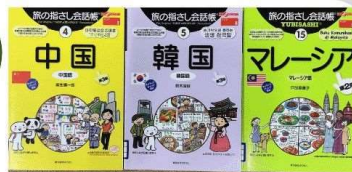
『旅の指さし会話帳 中国 韓国 マレーシア』 それぞれ 麻生晴一郎ほか ゆびさし 3000ごいじょうの ことがのっています！