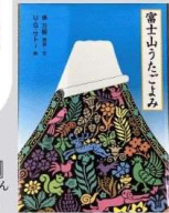
『富士山うたごよみ』 後方智 福音館書店