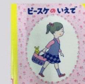
『ピースケのいえで』 たかどのほうこ 童心社