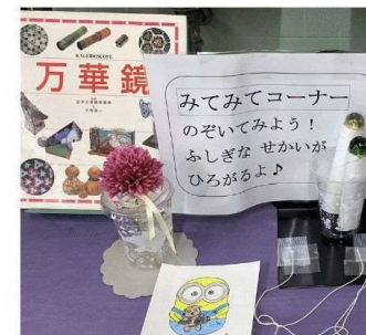
いえで かんたんにつくれるよ！