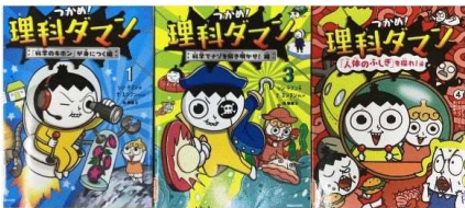
『つかめ！理科ダマン①③④』 シン・テファン マガジンハウス