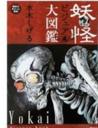
『妖怪ビジュアル大図鑑』 水木しげる 講談社