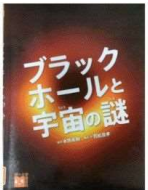
『ブラックホールと宇宙の謎』『ひがたはたらばこ』 本間希樹 岩崎書店 よしのゆうすけ 徳間書店