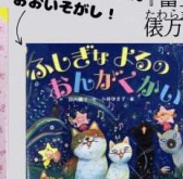
『ふしぎなよるのおんがくかい』 垣内磯子 小峰書店