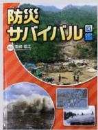
『防災サバイバル図鑑』 国崎信江 金の星社