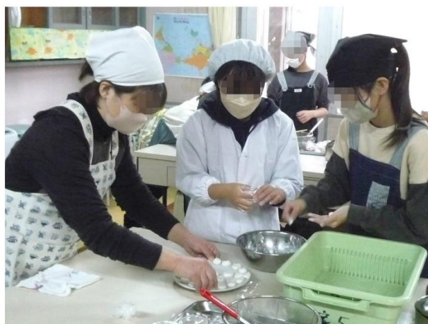
【調理実習ボランティア】