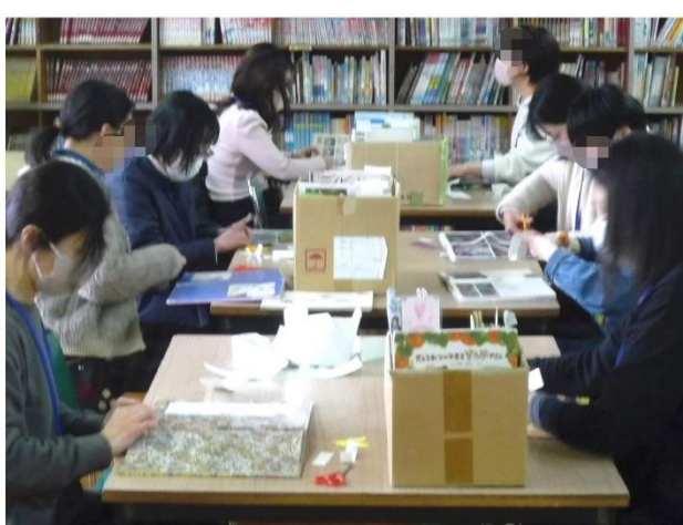
【図書館ボランティア】