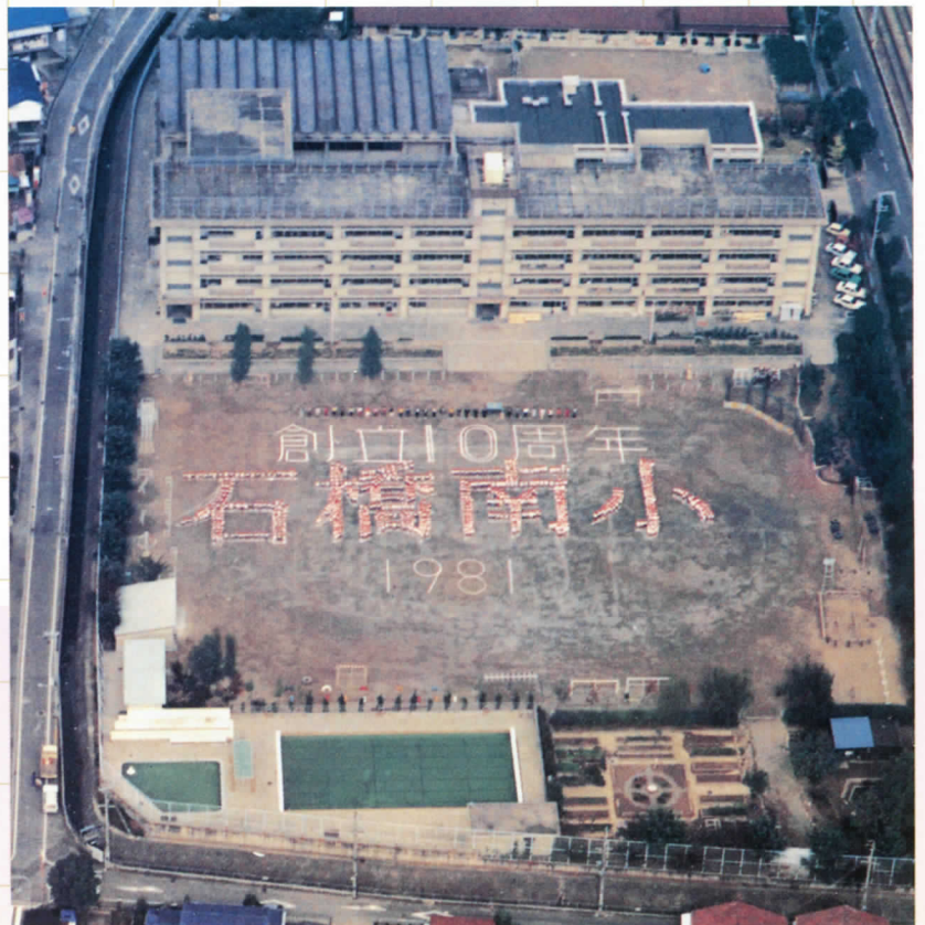
創立10周年を記念して航空写真を撮りました。