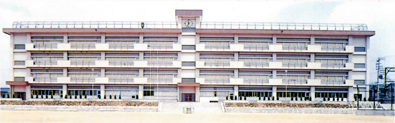
1972年校舎完成 りっぱな校舎が完成しました。