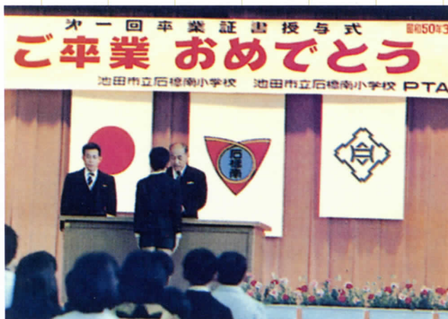
第1回卒業式 1975年3月18日、初めての卒業式で巣立った卒業生は、ちょうど100名でした。