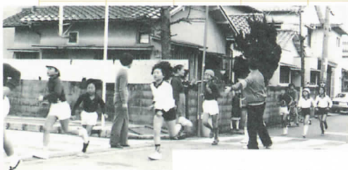
息をはずませでのマラソン大会