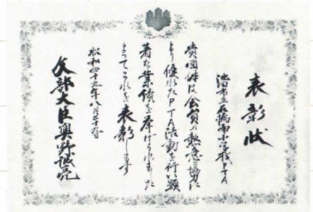
文部大臣表彰状 1974年8月29日、本校PTAのさまざまな活躍に対して、全国優良PTAとして文部大臣賞を受賞しました。