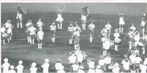
若人の祭典で活躍する金管バンドクラブ