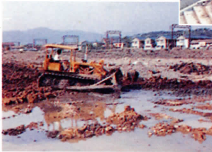
工事風景 1971年9月23日に工事が着工 され、急ピッチで進められました。