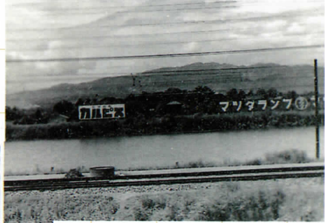
ありし日の前池 通称カルピス池とよばれた。 ここに今、学校が建っています。