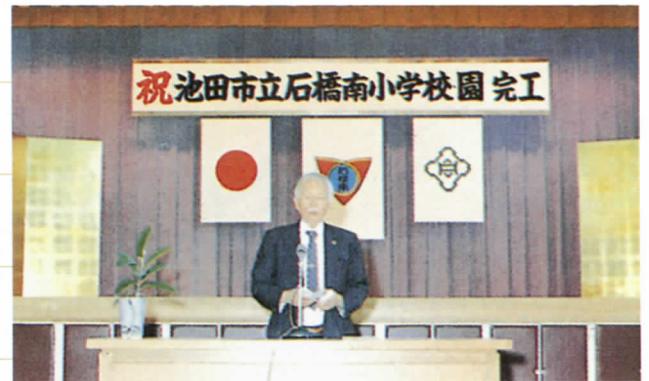
完工式 子ども達の、親達の、校区の人々の慶びと感激が会場いっぱいにあふれた盛大な完工式でした。